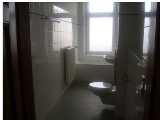
Beispiel aus WE 05