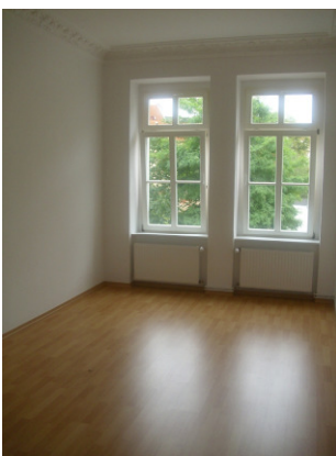
Beispiel aus WE 04

Der Stadtteil Gohlis liegt nördlich vom Leipziger Stadtzentrum. Gohlis gehört zu den begehrtesten Wohnlagen Leipzigs. Weit über die Stadtgrenzen hinaus ist das bekannte Gohliser Schlösschen, welches 1755/56 erbaut wurde und heute ein Restaurant und Cafe beinhaltet. Eine der beliebtesten historischen Parkanlagen - das Rosental - befindet sich ebenfalls in Gohlis und ist in wenigen Minuten zu Fuß erreichbar.